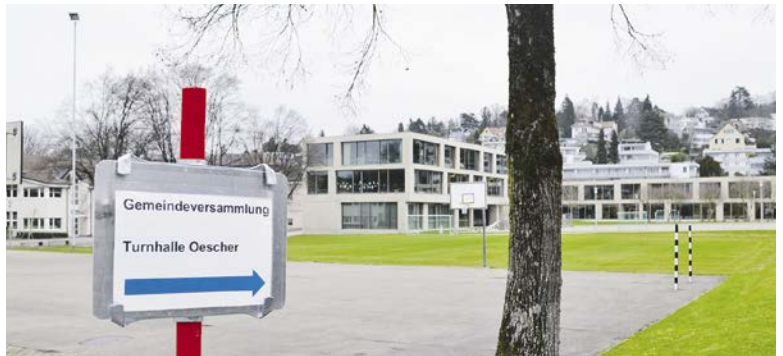
Dass die Gemeindeversammlung in die Turnhalle übertragen wird, kommt nur selten vor.

ZOLLIKON/ZUMIKON. 3,3 Prozent. So hoch oder eben tief ist die Stimmbeteiligung an Zolliker Gemeindeversammlungen im Durchschnitt der letzten 27 Jahre. Letzte Woche kamen dreimal mehr Stimmbürger. Übertroffen wurde diese Beteiligung lediglich bei der Abstimmung zum Abbruch des Fohrbach im November 1990. Und auch seit dem letztmaligen Antrag auf eine Urnenabstimmung sind etliche Jahre vergangen. Im Jahr 2000 hatte die Gemeindeversammlung bei einer Beteiligung von knapp über vier Prozent der Stimmberechtigten grünes Licht für die Ausarbeitung einer Tageschule gegeben. Der Antrag auf Urnenabstimmung verfehlte damals das Ziel um fünf Stimmen. Ähnlich sieht die Situation in Zumikon aus. Gemeindeglied Thomas Kauflin sagt auf Anfrage, er müsste ins Archiv steigen und alte Bände durchforsten, um herauszufinden, wann im Vergleichszeitraum ein Antrag auf eine Urnenabstimmung gestellt wurde. Während der letzten neun Jahre,